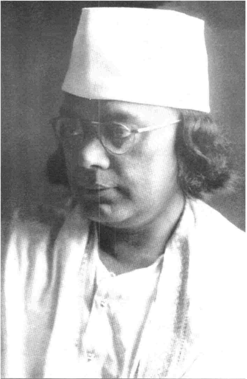
কাজী নজরুল ইসলাম